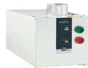
Extractor para armarios altos con control del flujo Referencia 14220