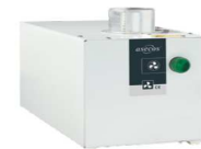
Extractor para armarios altos, sin control de flujo Referencia 14218

Sistema de recirculación con filtro ASECOS para armarios de seguridad